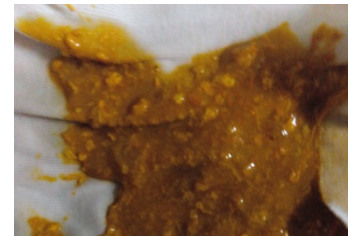
第四、五天后: 金黄色, 比较稀