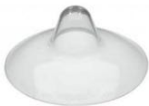
环形的乳头保护罩 不容易变形，比较固定