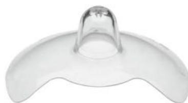
切去小部分的乳头保护罩 会帮助宝宝闻到妈妈的乳晕